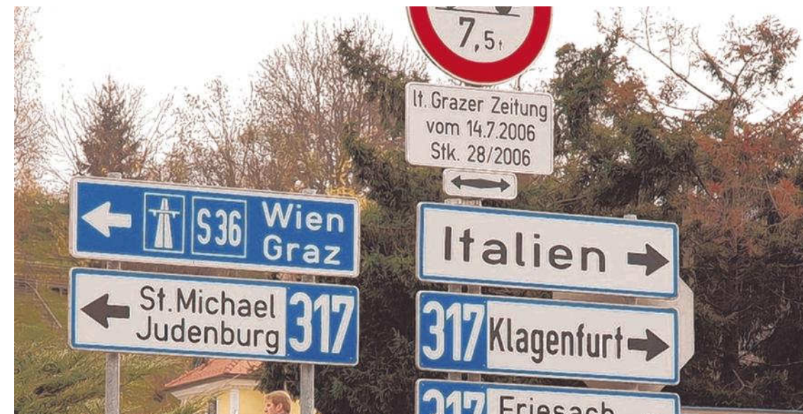
Laut Asfinag wird am Ausbau der S 36 festgehalten. Was die S 37 angeht, sind weitere Untersuchungen notwendig.

sucht werden. Wie lange diese dauern werden, ist noch unklar und auch ein definitiver Baustart steht, wie auch Höferl einräumen muss, noch nicht fest.